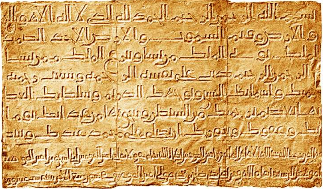
Inscription de l'an 692 (72 H) - Dôme du Rocher (Jérusalem)